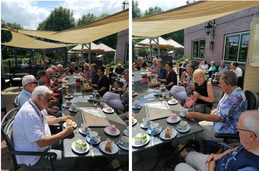
Gezellig samenzijn op het terras buiten