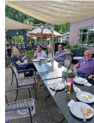
Lekker buiten eten