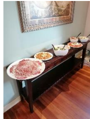
Het opgestelde buffet